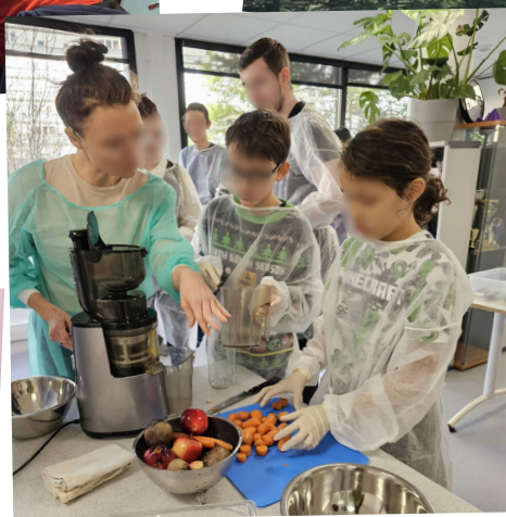
Atelier Cuisine Déc 2024