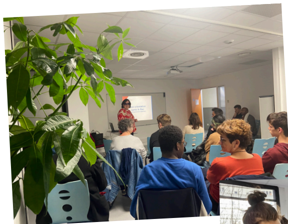
Conférence Orientation Nov 2024