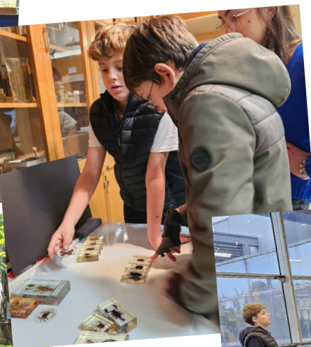
Fête de la Science à l'ENS Sept 2025