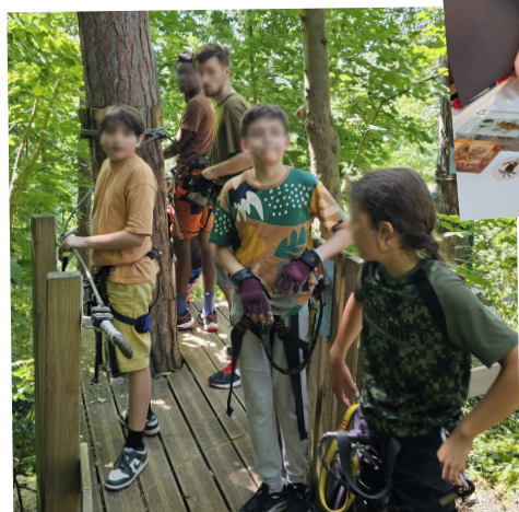
Sortie Accrobranche Juil 2025