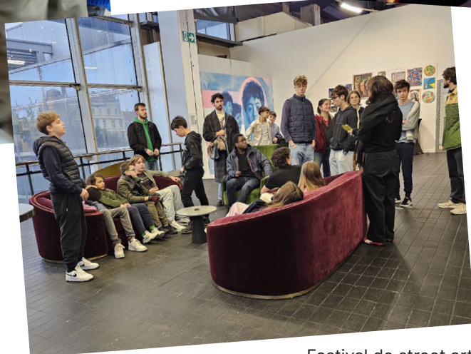
Festival de street art Oct 2025