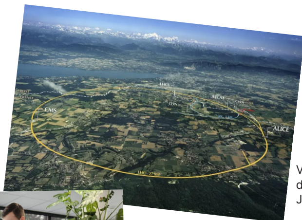
Visite du CERN Janv 2025